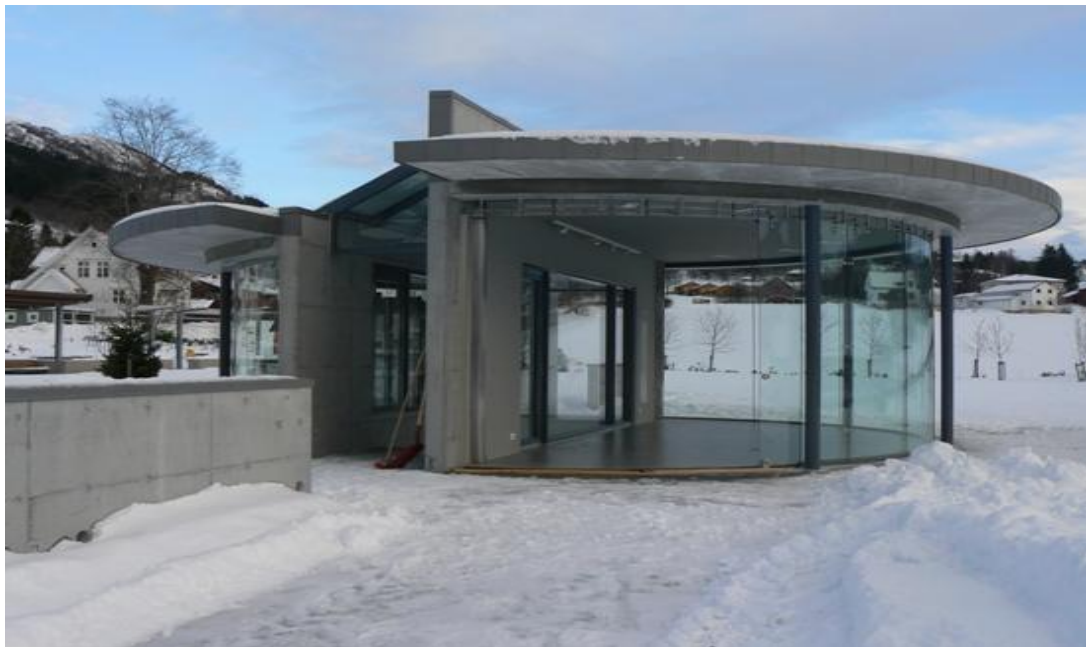
Det flotte, nye utstillingslokalet stod klart til å ta i mot den nye bebuaren.

* Lokomobilen flytta! Det "gamle" lokomobilhuset står i vegen for nye vegløyningar i sentrum, og eit flott, nytt hus har kome opp i Bankparken. Laurdag 8.januar 2011 var ein ny milepel nådd, i det det var klart for flytting av lokomobilen over i det nye huset. Først vart klenodiet slept over i vaskehallen til Sjøholt Last og Buss for ein grundig vask. Deretter var det flytting med bil over til det nye huset. Alt gjekk prikkfritt etter planen, og lokomobilen står no til ålment påsyn i sitt nye utstillinglokale. Huset har også funne plass til modellen av Sjøholt Hotell. Ørskog Sparebank har stått for finansieringa av utstillingslokalet