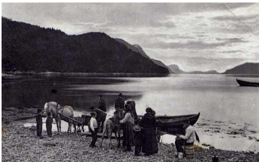
Fotograf: Axel Lindahl Datering: 1870-åra Motiv: Personar i Prestefjóra. Eigar: Ørskog Historielag