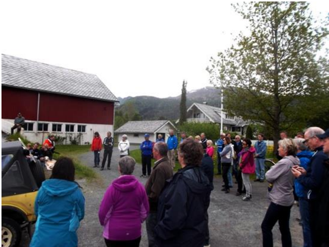
BYGDEVANDRING 25. mai 2014 Valgermo – Giskemo – Vallbøane.