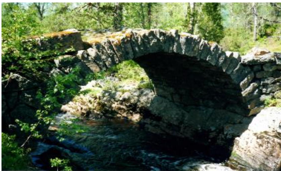
Kvelvingsbrua over Svartløkelva. Foto 07.06.2000