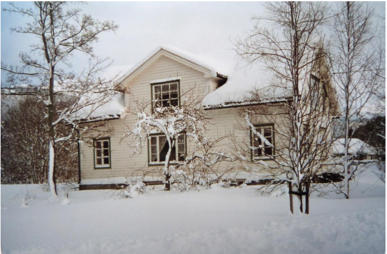
PAKTARHUSET PÅ PRESTEGARDEN – VESTSIDA VINTERSKRUD