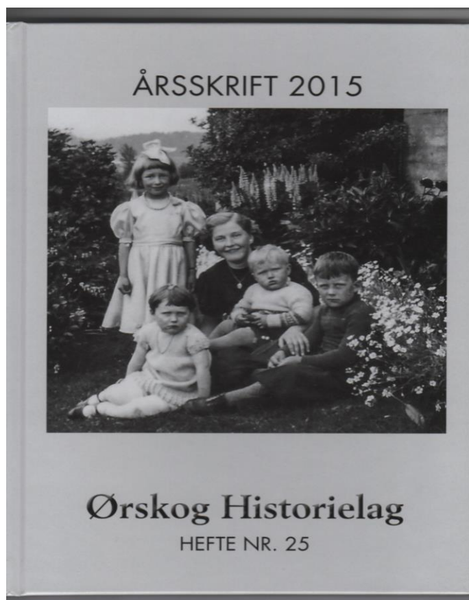
Forside årsskrift 2015

Vi viser elles til innhaldslista og naturlegvis sjølve skriftet.