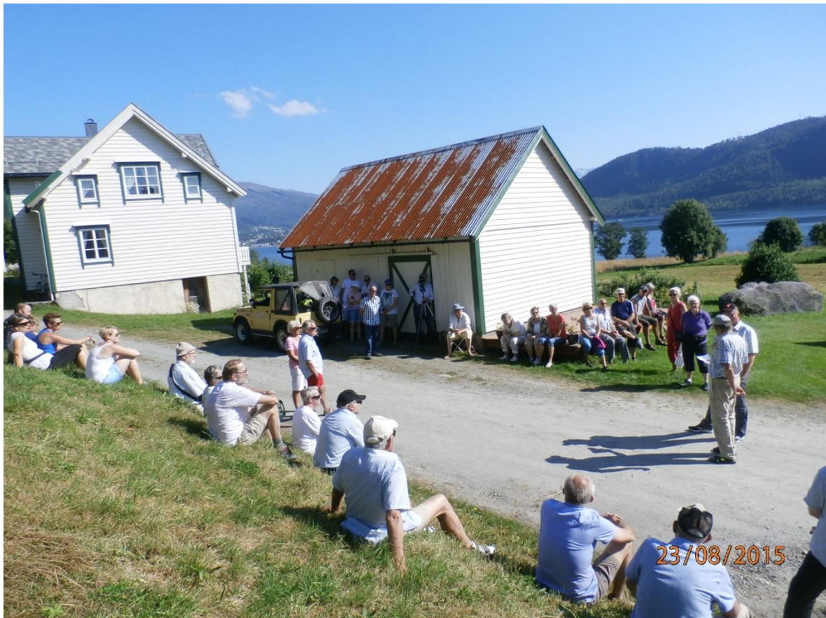
BYGDEVANDRING 23. august 2015 – Apalset til Steinane. Her frå --- på Apalset – vakkert sommarver!