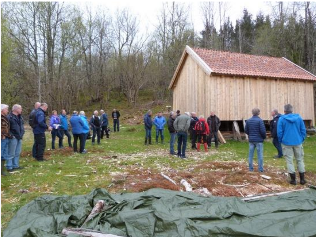
Onsdag 4.mai 2016 var historielaget på tur til Langskipsøya for å sjå på den gamle løa som Storfjordens Venner har restaurert. Den falleferdige løa har blitt god som ny!

Samla oversyn over alle kveldsetene sidan 1998 - også planlagde kveldseter og bygdevandring i 2017 - finn vi på laget si heimeside: www.orskog.historielag.org