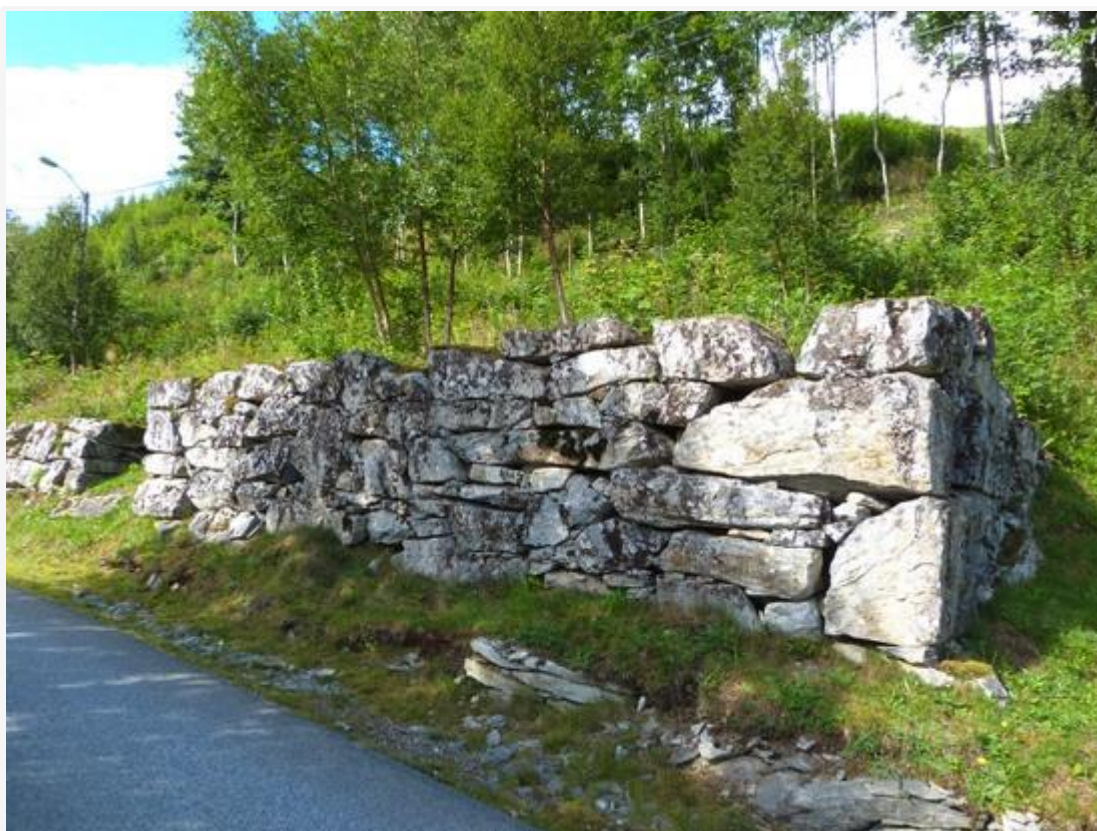
Murane etter det første skulehuset ligg ved den gamle hovudvegen.