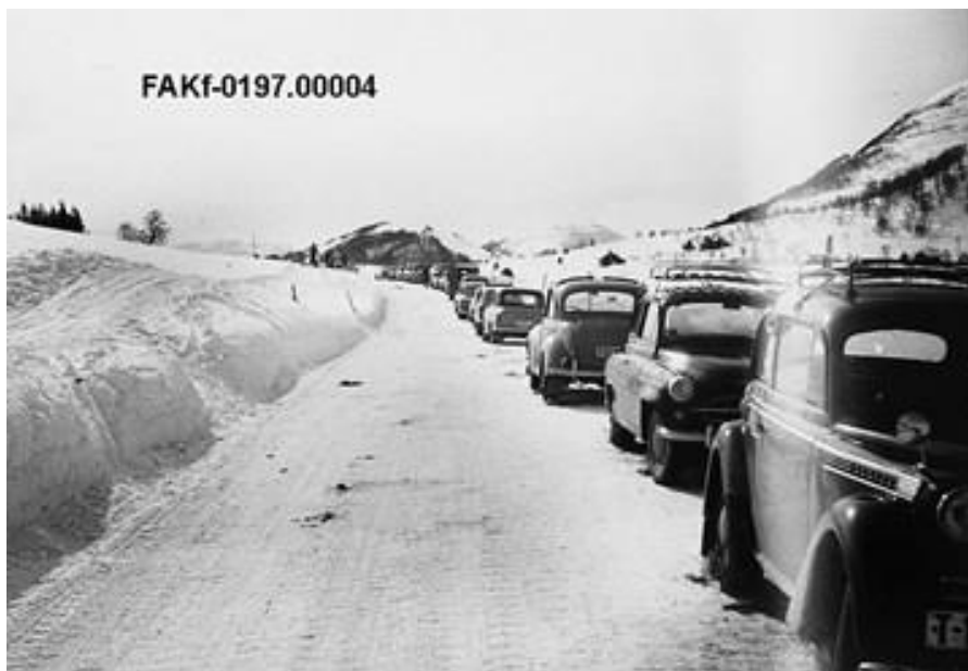
ØRSKOGFJELLET 1950-60-TALET Stor skiutfart med parkering berre langs riksvegen Lokal registrering: Tore Gjære 1999