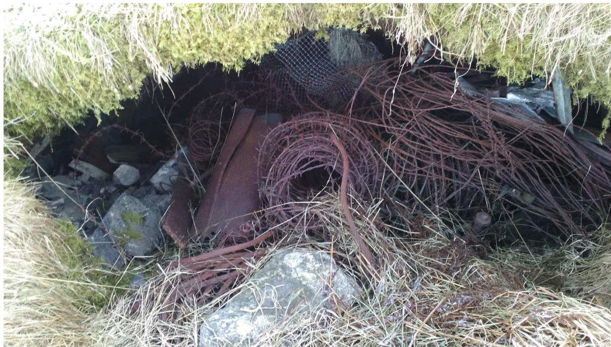
Verahornet februar 2017.

Eit av dei siste synlege merka etter tyskarane sitt opphald her under krigen 1940-45 Eit kulturminne for komande kulturminneplan!