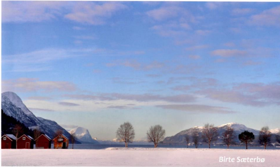
Prestefjora ein vinterdag i 2016.