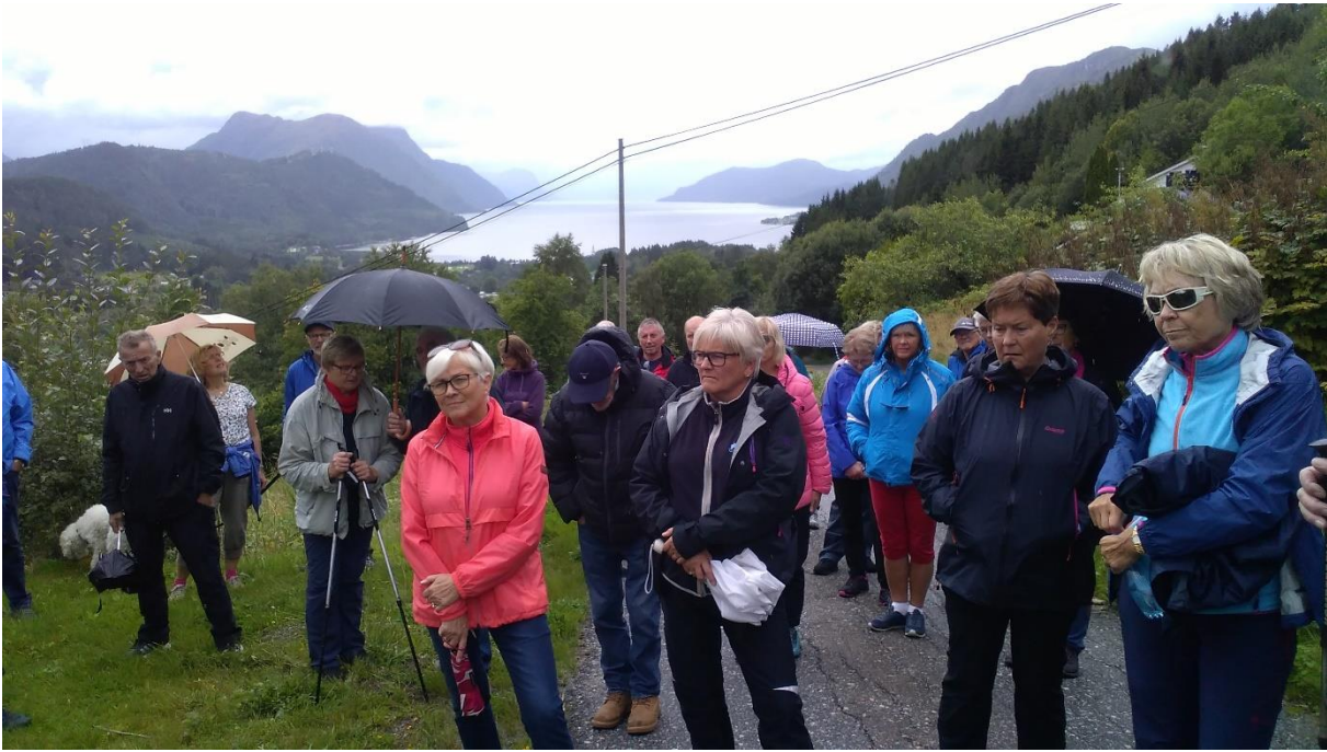
På veg opp bakkane mot Bårdsgjerde. Nokre regndropar, men eit godt lyttande publikum.