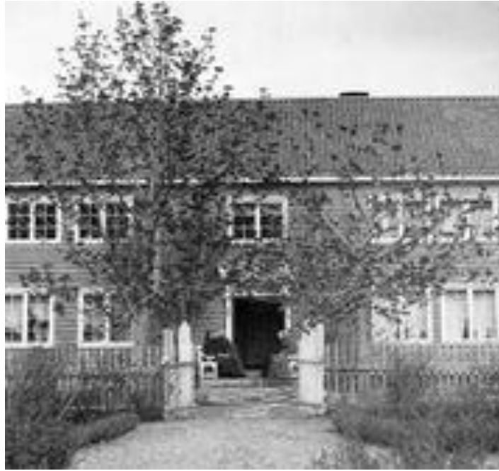
Prestegarden i Ørskog langt tilbake.