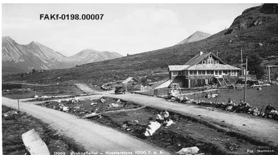
Nysæterstova med den gamle og den nye vegen (1935-1945)