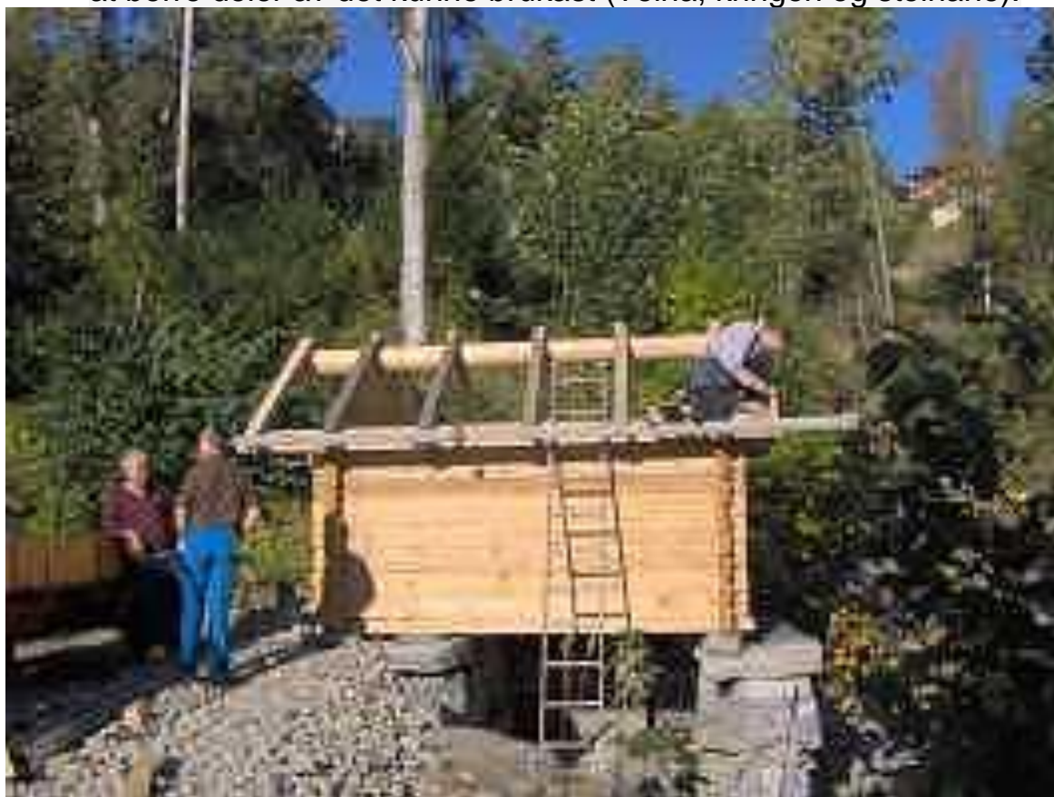
Etter kvart syntet det seg at det var i så dårleg forfatning at berre deler av det kunne brukast (Teina, kringen og steinane).

Siste sperra blir spikra fast. Plassering Wenzellelva nord for Sjøholt Hotell . Ansvar for stell og vedlikehald: Teknisk utval.