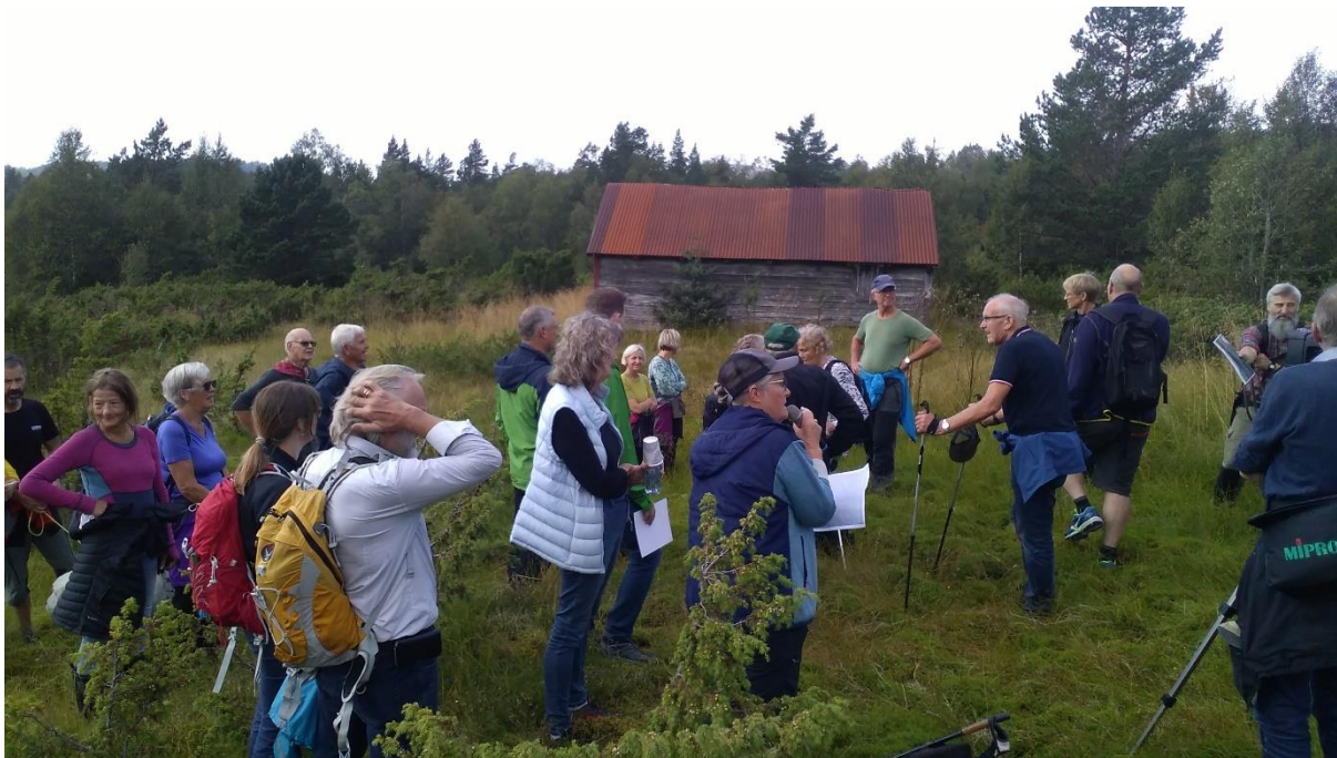
Sjøholtsætra 25. august 2019