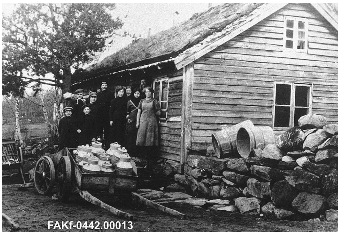
Vaksvikbygda Meieri var einaste meieri i Vaksvika. Det vart starta i 1895 og slutta i 1918. Det starta så opp att i 1927, og vart endeleg nedlagt i 1937. Selskapet vart avvikla i 1938. Det var eit aksjeselskap (el. andelslag?) og tok imot mjølk frå Vaksvik, Vestre, Skarbø og Jordskar. Sjå elles Ørskog Gjennom Tidene