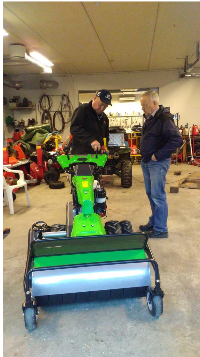
Ny beitepussar november 2019.

Postvegmarsjen vart arrangert for 14. gong 11. september 2016. I 2017 vart det av ymse grunnar ikkje arrangert Postvegmarsj. Dette var også tilfelle i 2018. Gått ut på dato – eller? Marsjen har vore eit samarbeidsprosjekt mellom Ørskog I.L, Ørskog kommune, Friluftsrådet og vårt eige lag.