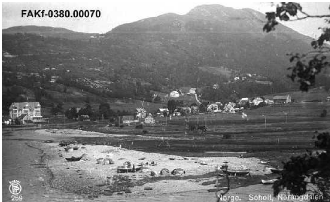
Sjøholt 1905-1910, med fisketørking på Måsøyrane. (Sjøholt ligg nok ikkje i "Norangdalen")