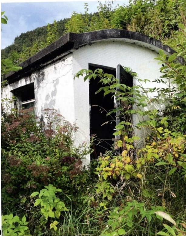
0 Vaskarhuset Jokumrenna