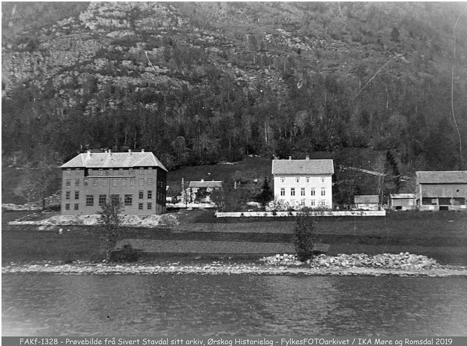
FAKf-1328 - Provebilde frå Sivert Stavdal sitt arkiv, Ørskog Historielag - FylkesFOTOarkivet / IKA Møre og Romsdal 2019

Rydding av hele traseen utført august 2024. En årlig rydding av traseen anbefales.